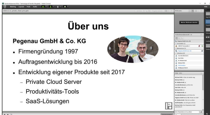
Abbildung 4 : Präsentation Thema3