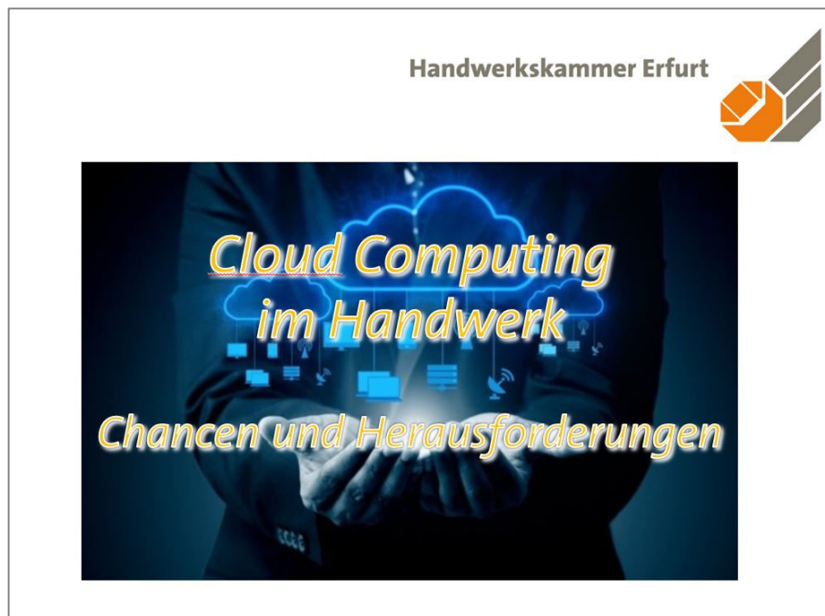
Abbildung 1: Präsentation Hauptthema

Cloud-Computing ist in vielen Bereichen, wie zum Beispiel in der Industrie wie auch im privaten Bereich schon angekommen. Hier wurden die Vorteile, welche die Cloud mitbringt erkannt, wobei vor allem im privaten Bereich die Gefahren, die die Nutzung von Cloud-Systemen mit sich bringen unterschätzt oder einfach nicht gesehen werden. Kleine und mittelständige Unternehmen sollten die Vorteile, die eine Cloud mitbringt gegenüber den Nachteilen und Gefahren abwägen. Ein Unternehmen kann die Nachteile und Gefahren durch entsprechende Maßnahmen, wie z.B. die Auswahl des Anbieters und eine entsprechende Vertragsgestaltung auf ein vertretbares Maß minimieren. Zusammen mit renommierten Anbietern von Branchenlösungen werden in einzelne Onlineseminaren verschiedene Lösungsansätze für einen Cloud-Einsatz im Handwerksunternehmen vorgestellt und Handlungsempfehlungen dargestellt.