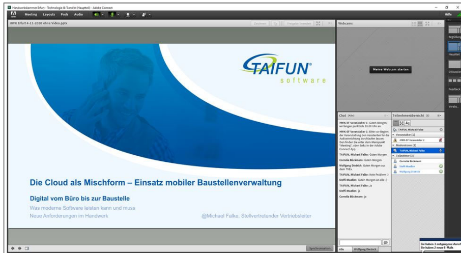
Abbildung 3 : Präsentation Thema 2