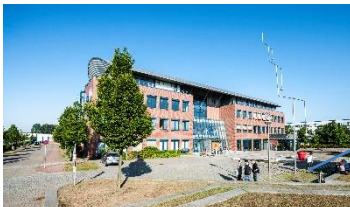
Bildungs- und Technologiezentrum in Schwerin-Süd