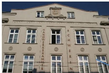
Schwerin Zentrum, Sitz der Handwerkskammer